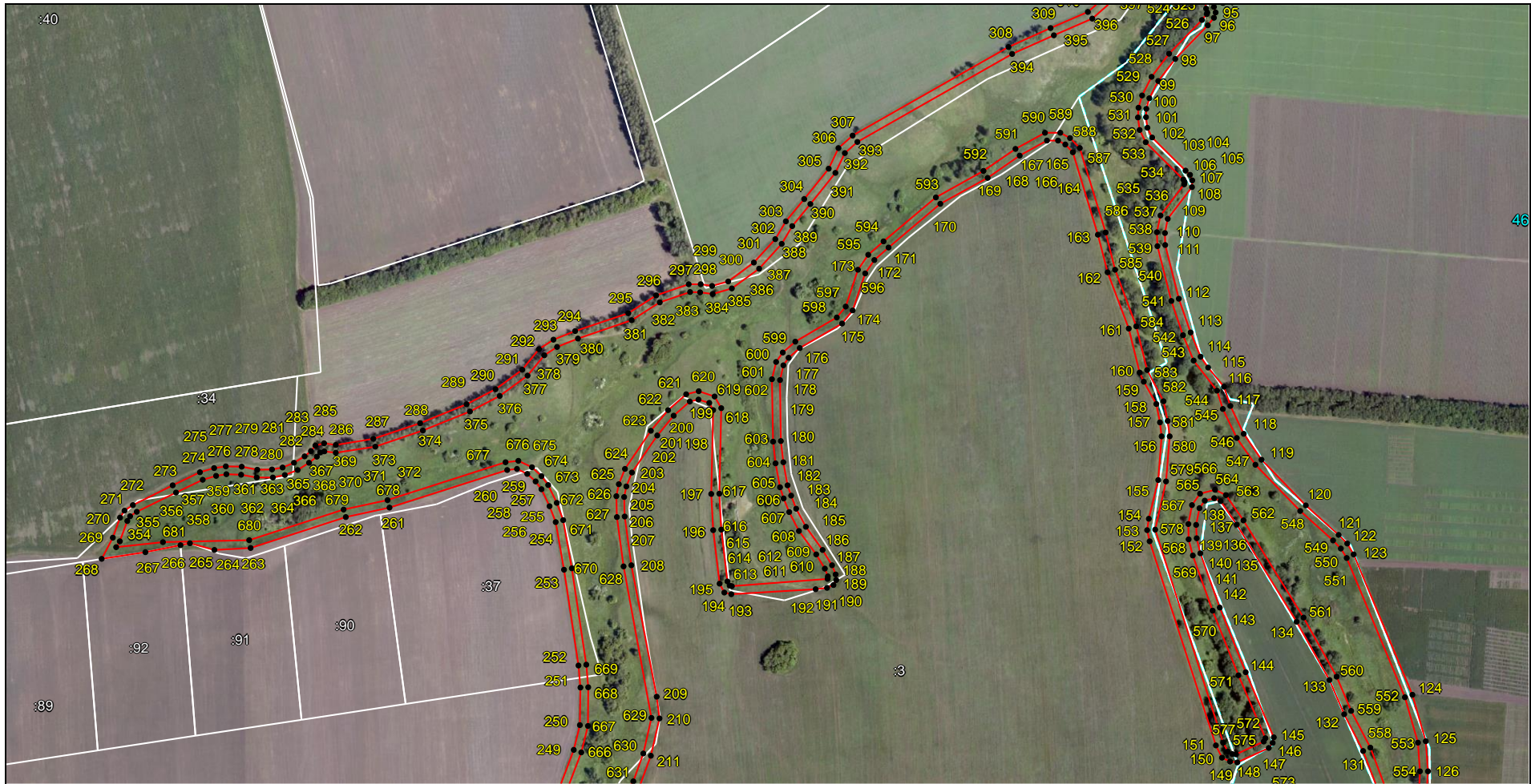
Выносной лист 3