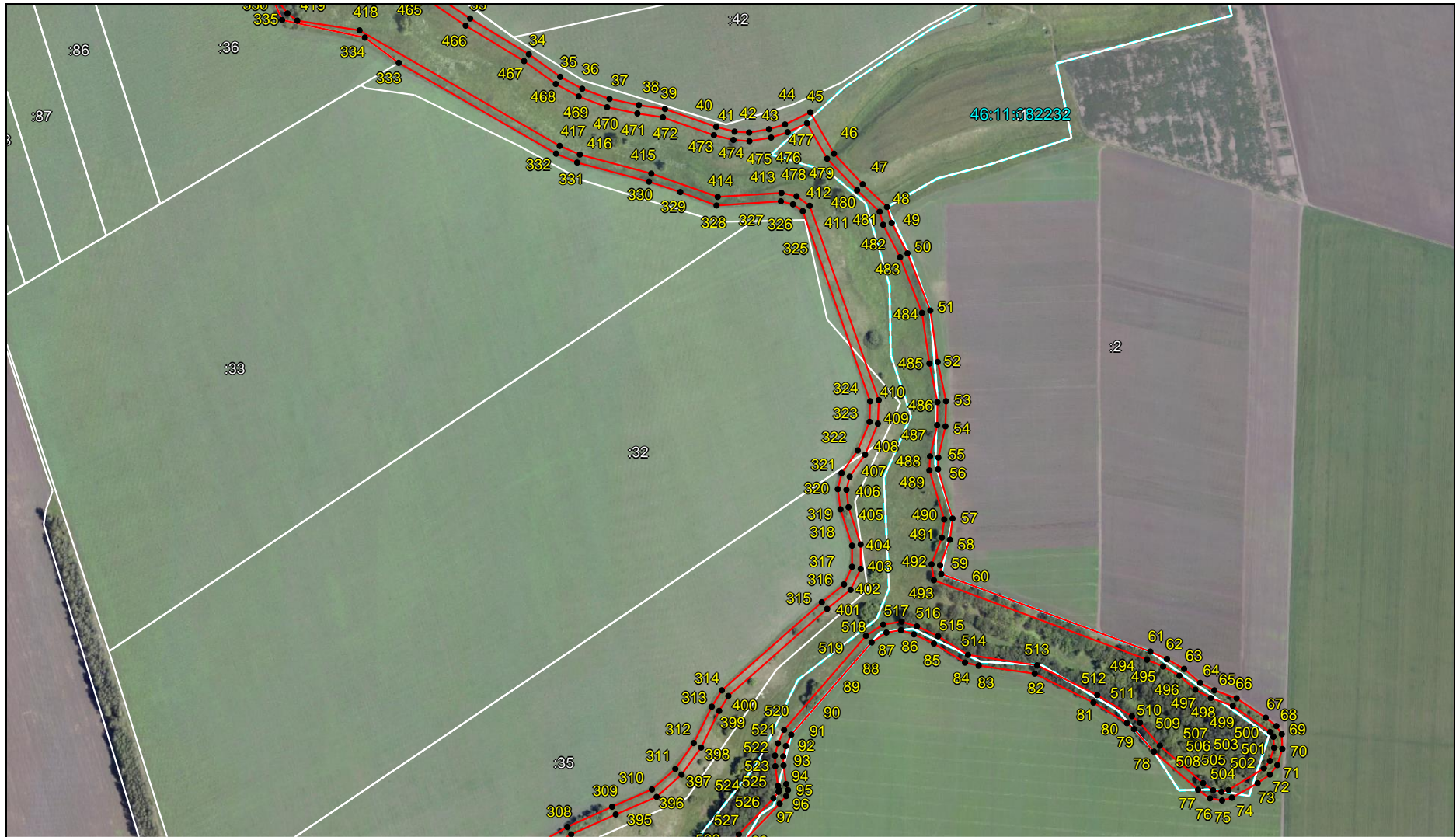
Выносной лист 2