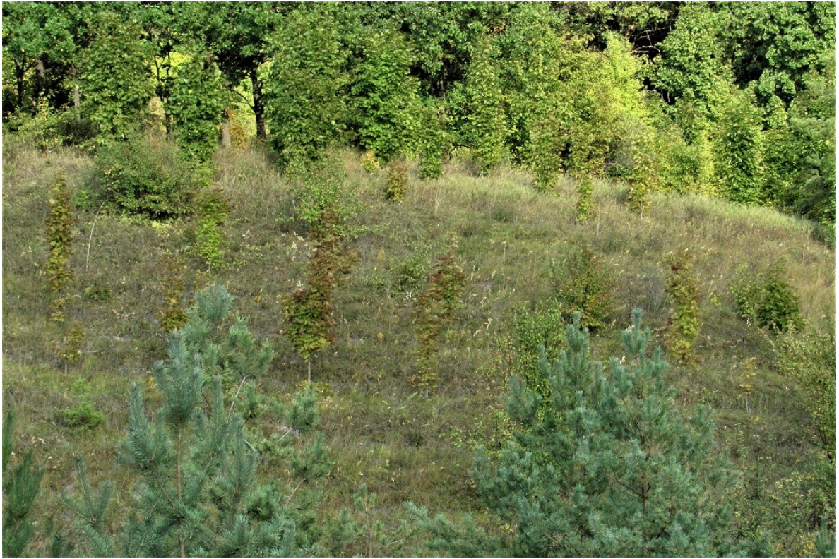
Фото 2. Посадки ясеня пенсильванского и сосны обыкновенной на склонах балки