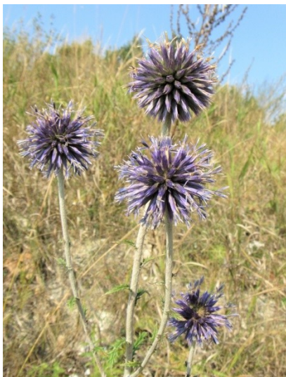
Фото 12. Мордовник русский