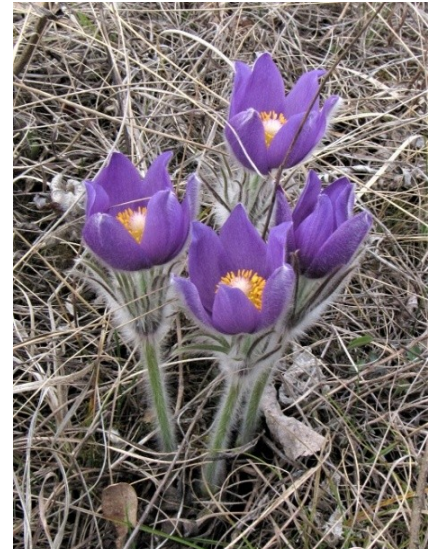
Фото 8. Прострел поникший