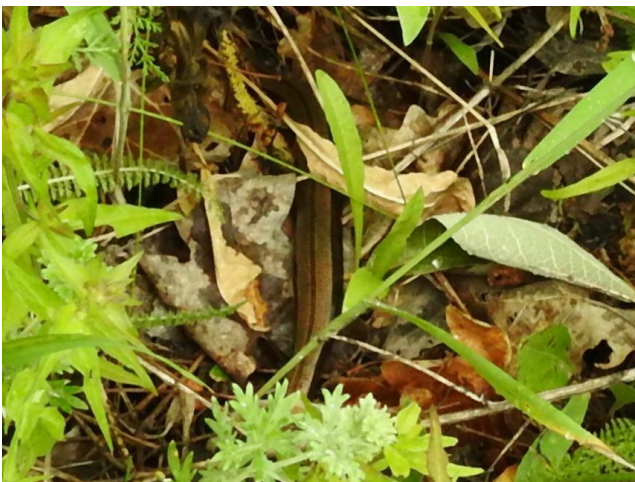
Фото 19. Ломкая веретеница