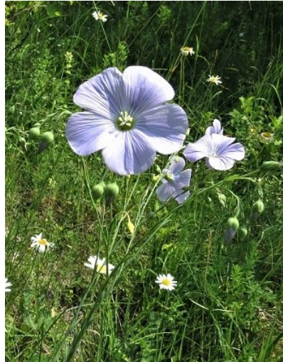
Фото 10. Лен многолетний