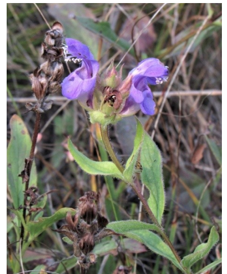
Фото 14. Черноголовка крупноцветковая