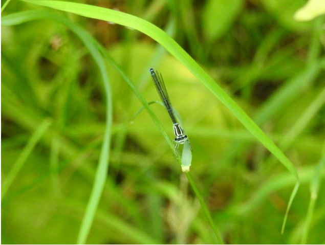
Фото 15. Стрелка-девушка