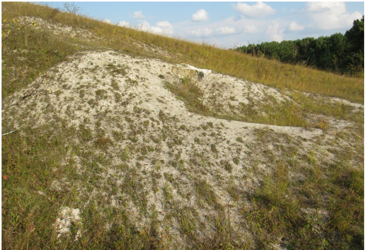
Фото 3. Эродированный зарастающий склон балки