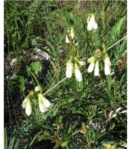
Фото 11. Оносма простейшая