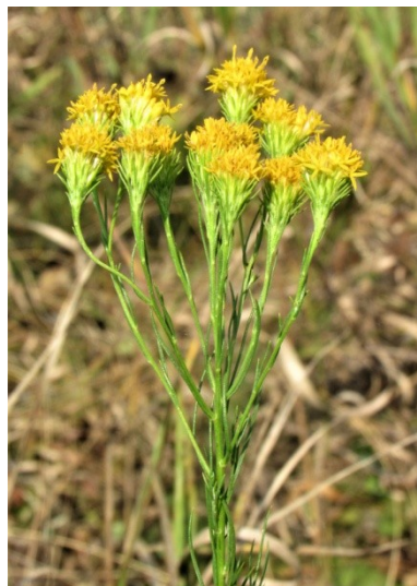
Фото 13. Солонечник льновидный