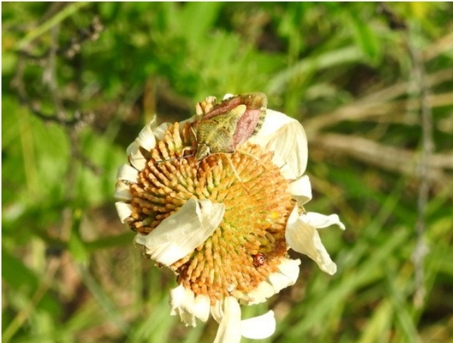
Фото 17. Щитник черноусый