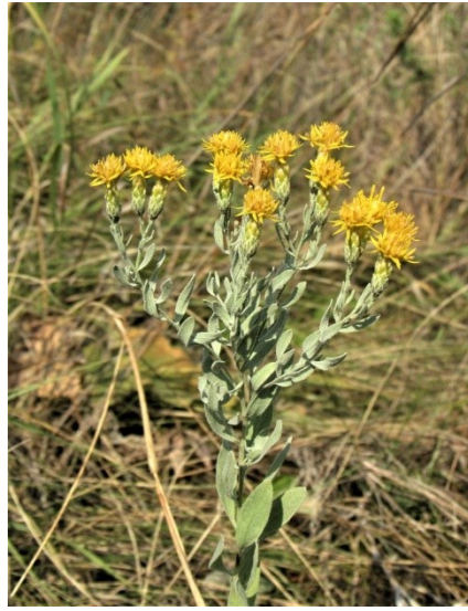
Фото 7. Солнечник мохнатый