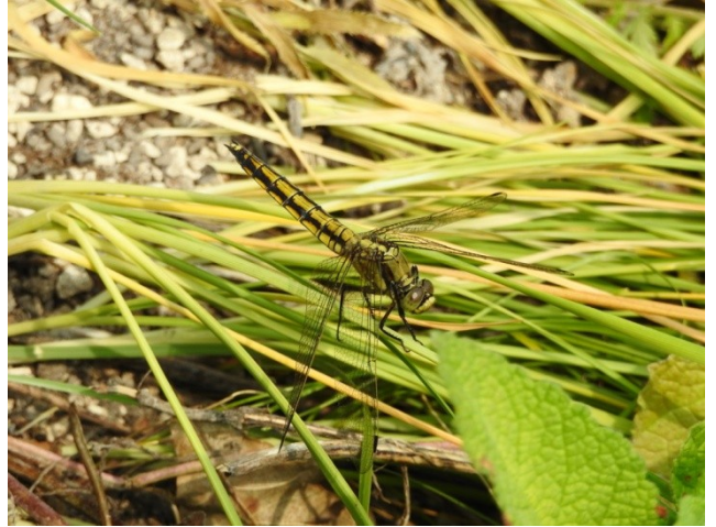
Фото 16. Стрекоза решетчатая