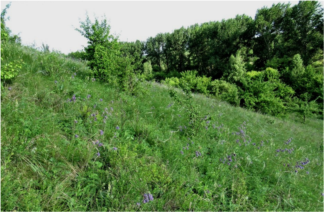
Фото 4. Разнотравная луговая степь