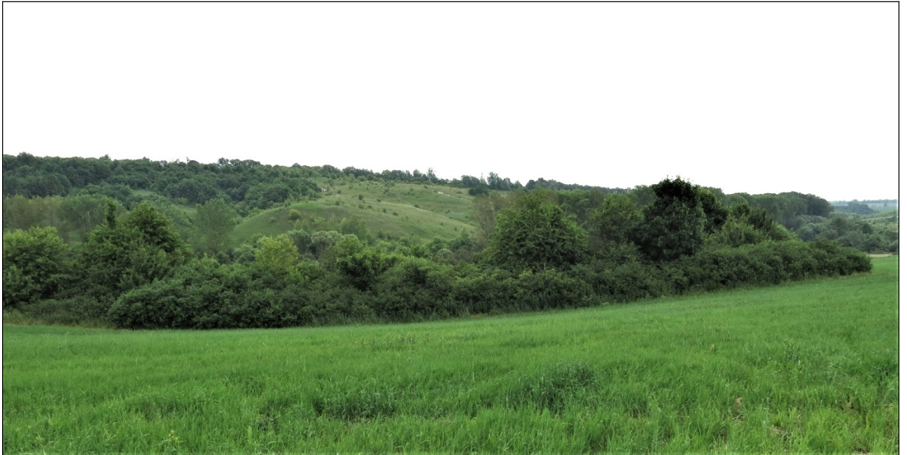
Фото 1. Общий вид на урочища Заломное