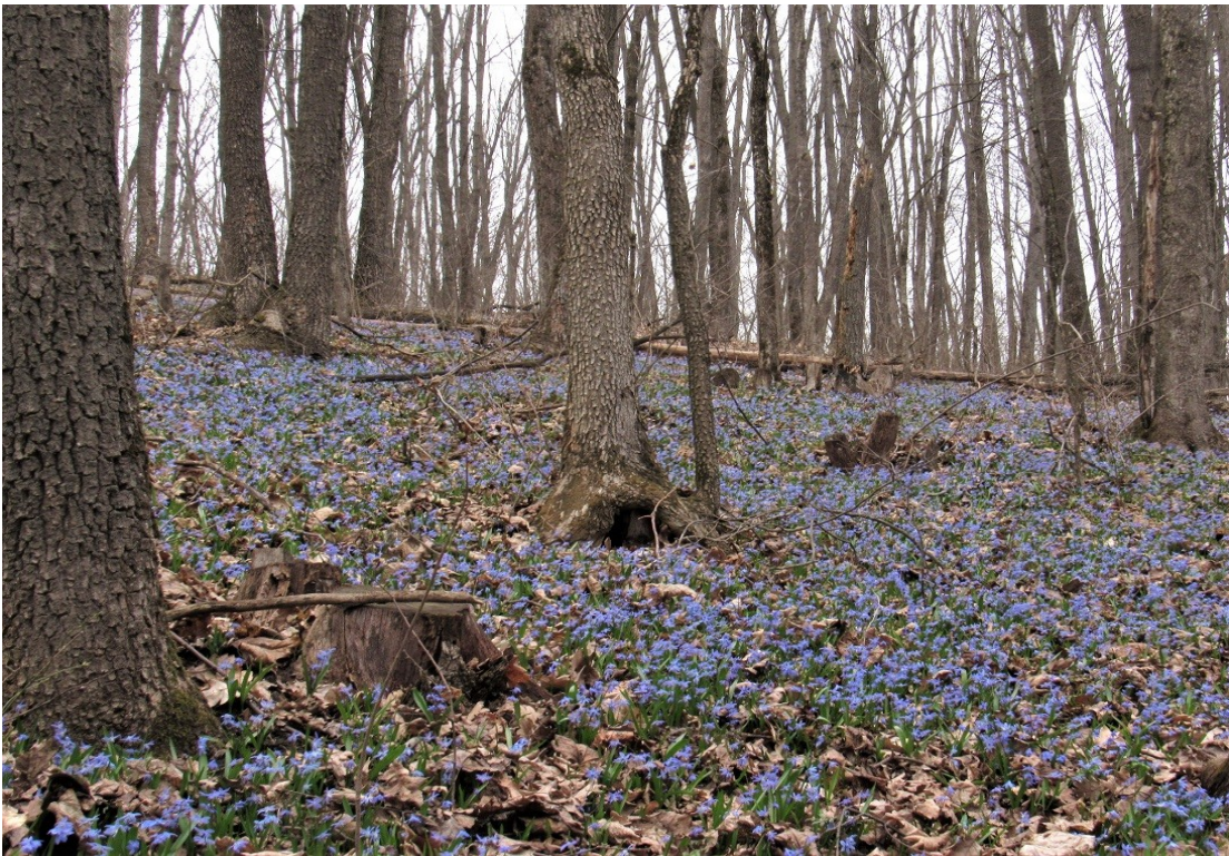
Фото 5. Широколиственный лес с пролеской сибирской в травяном ярусе