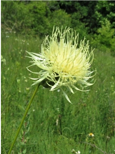
Фото 9. Василек русский