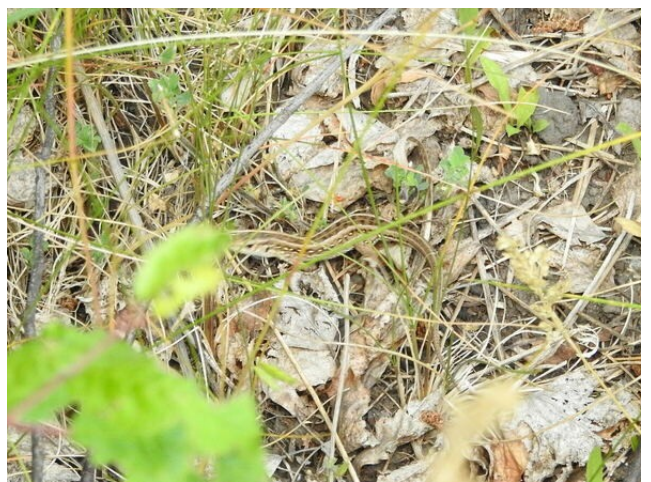
Фото 20. Прыткая ящерица