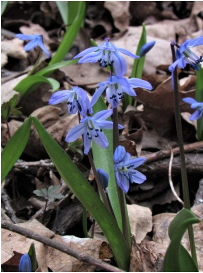
Фото 6. Пролеска сибирская