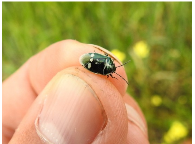
Фото 18. Щитник рапсовый